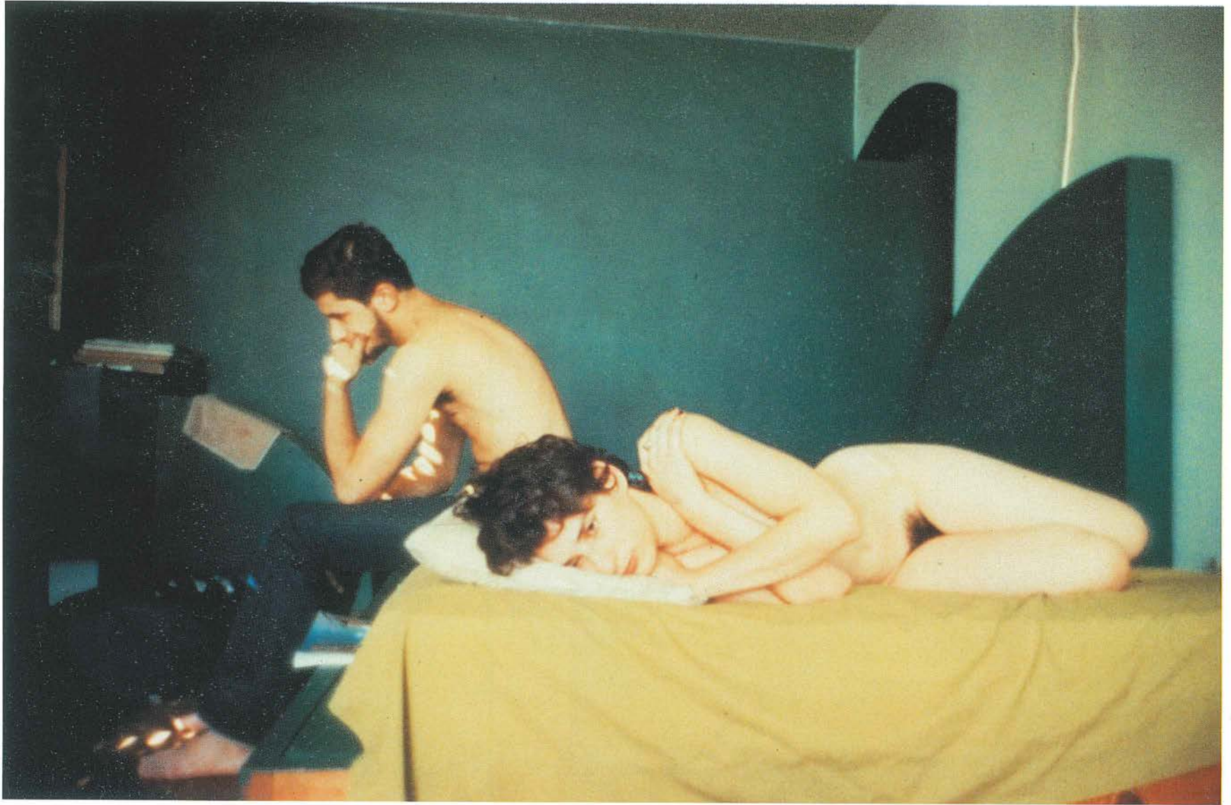
Couple in bed, Chicago 1977.