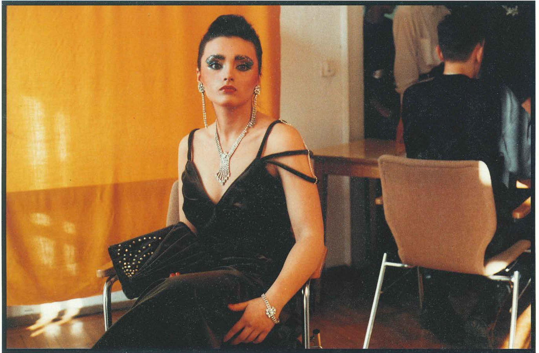
o.T. Dresden 1989