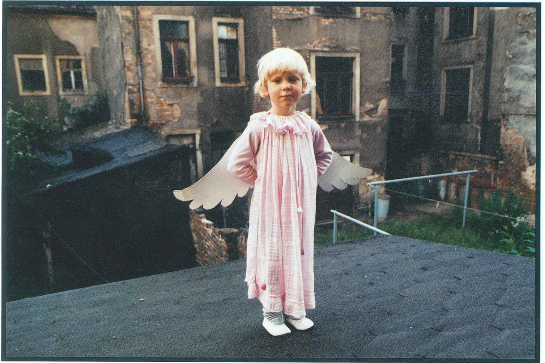
o.T. Dresden 1987